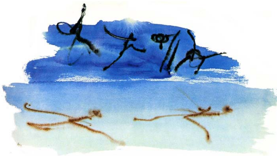
Henri Michaux, aquarelle sans titre , 1965