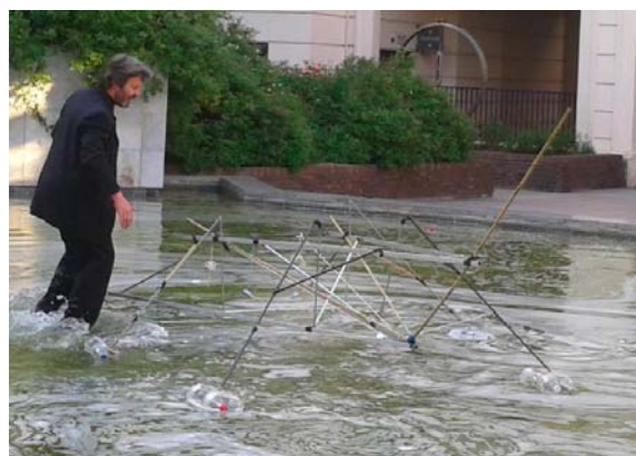
Sortie de résidence à l'Avant-Rue à Paris. Dans une fontaine.