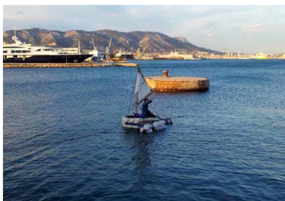
Sortie de résidence à La Seyne-sur-Mer.